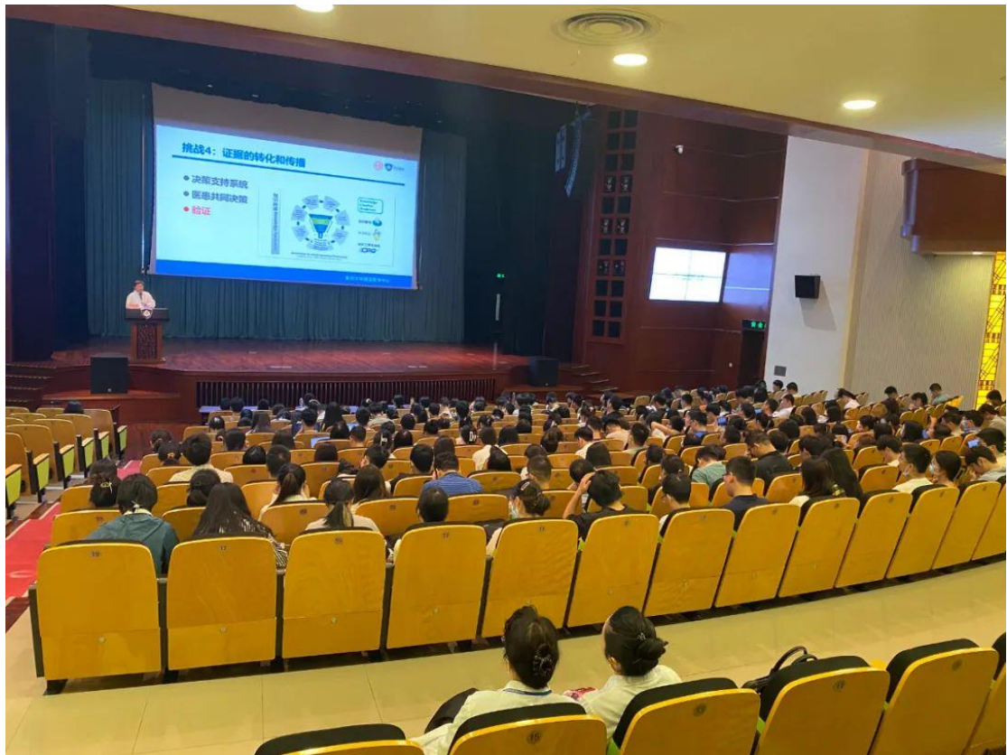
院级督导专家督导住院医师入院教育